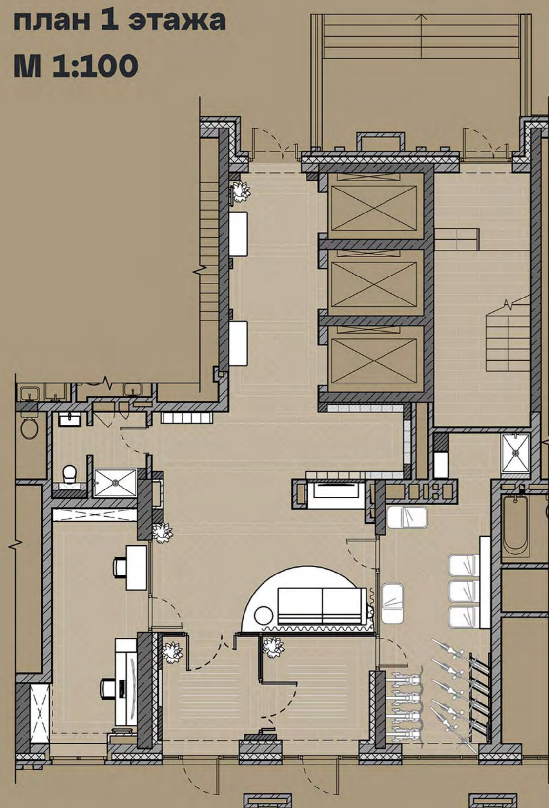
план 1 этажа М 1:100