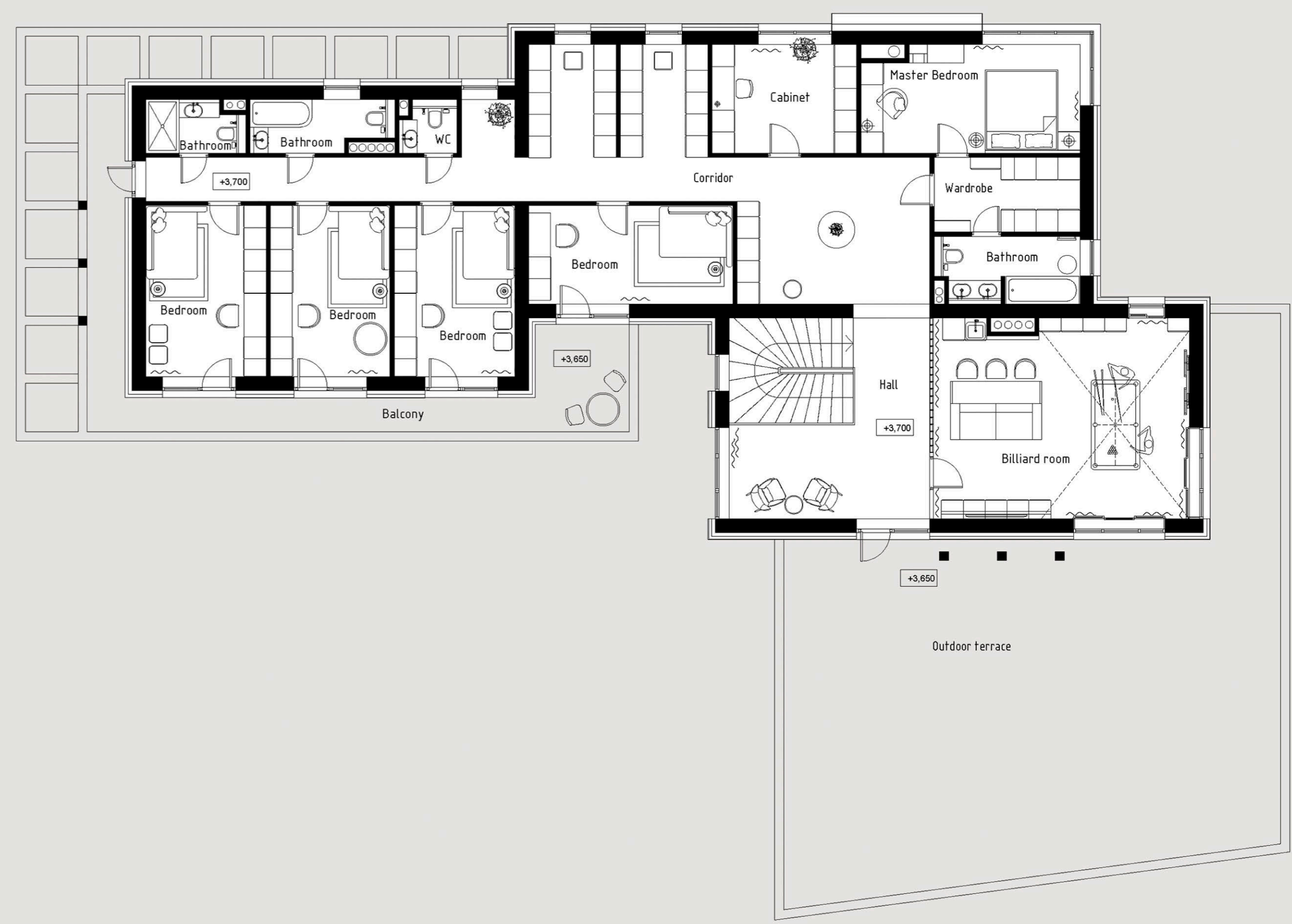
2nd floor plan