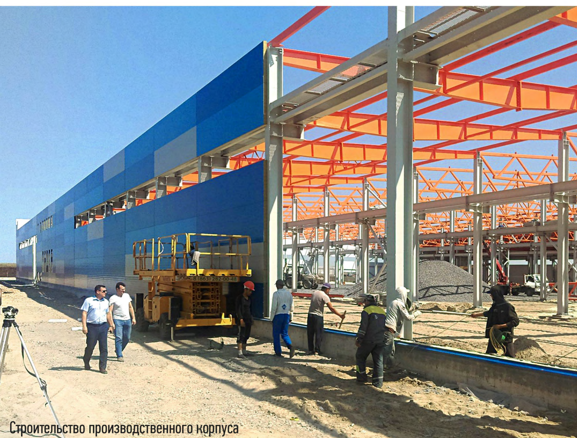
Строительство производственного корпуса

Комплекс расположен за городом и хорошо виден с трассы. Цветовое решение продиктовано фирменным стилем компании. Фасадные решения демонстрируют посетителям и клиентам возможности применения продукции МеталлПрофиль. Наружные стены производственного корпуса выполнены из классических трёхслойных сэндвич-панелей. В общем решении административного корпуса применены: смещённый шаг, разные оттенки цветов панелей, консоль и соседство с витринным остеклением — всё это призвано демонстрировать возможности применения систем, производимых в данном комплексе.