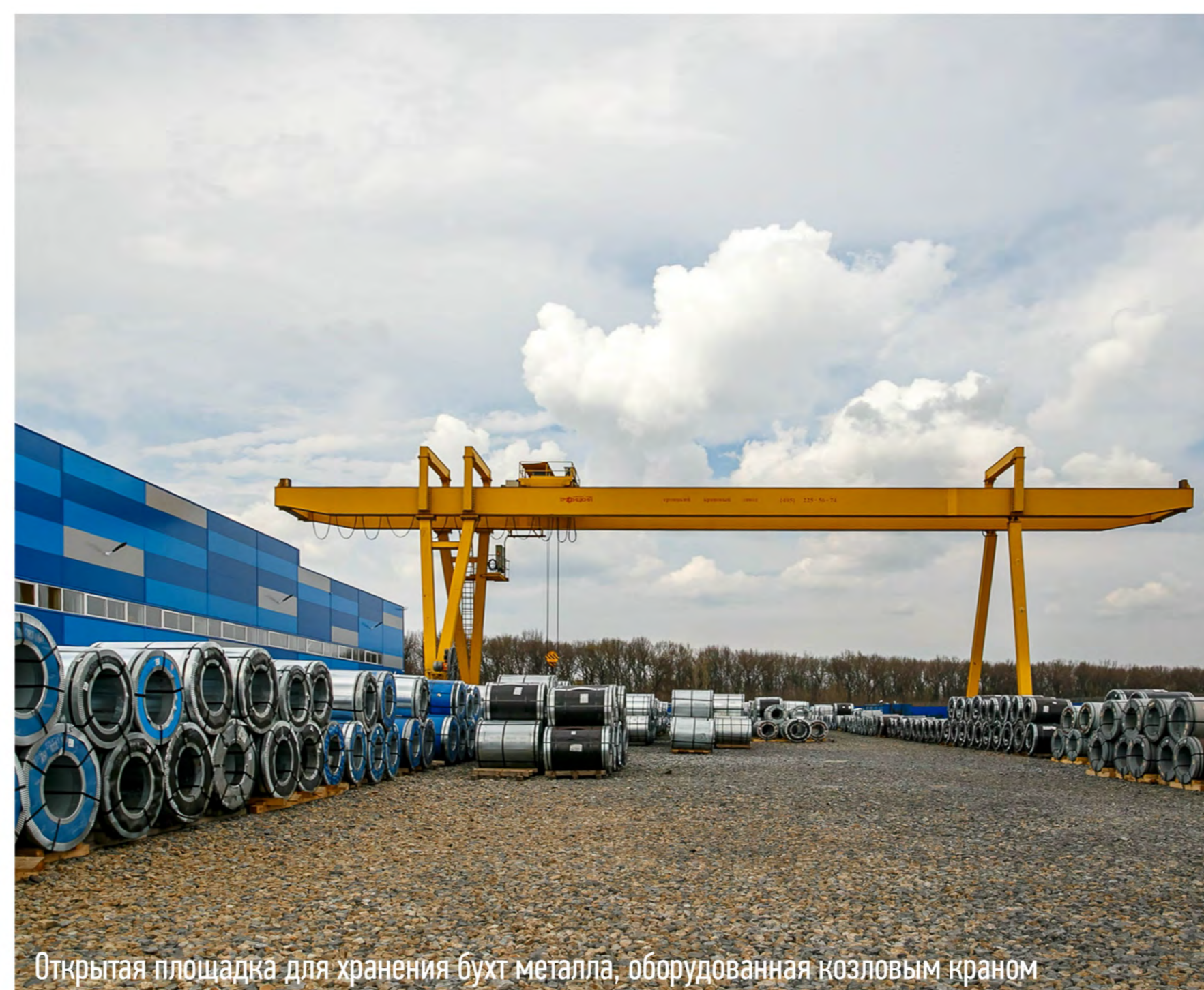
Открытая площадка для хранения бухт металла, оборудованная краном