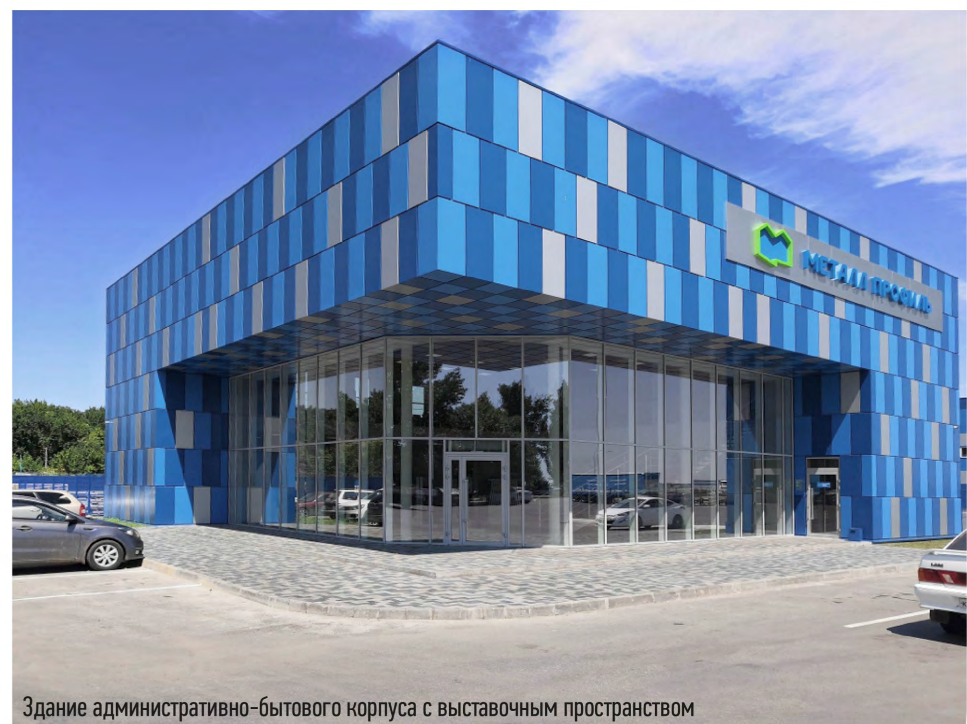
Здание административно-бытового корпуса с выставочным пространством