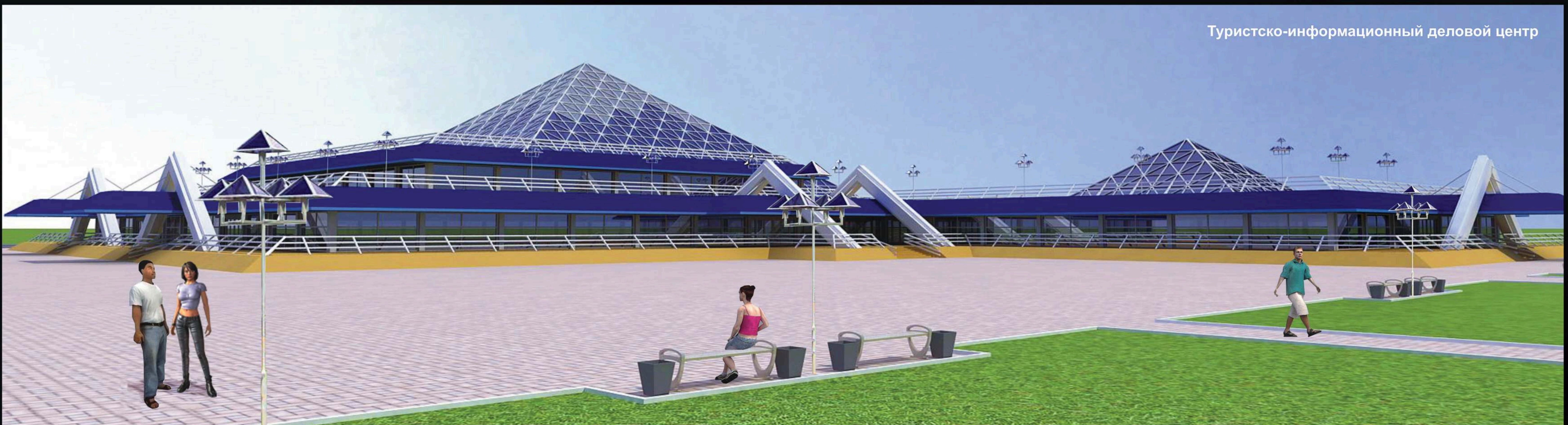
Туристско-информационный деловой центр