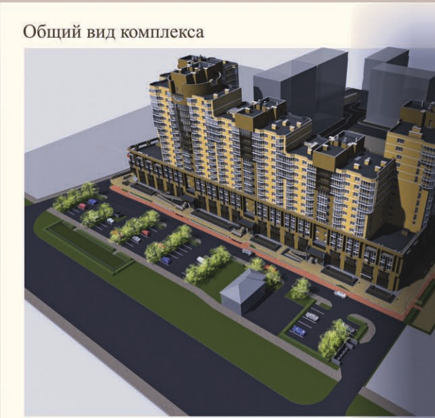
Общий вид комплекса

В состав комплекса входят пять многоэтажных (от 13 до 17 этажей) жилых блок-секций со встроенными в нижние этажи нежилыми помещениями, а так же пристроенные 4-х этажные Спортивно-оздоровительный комплекс и Офисное здание