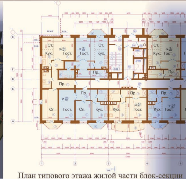
План типового этажа жилой части блок-секции