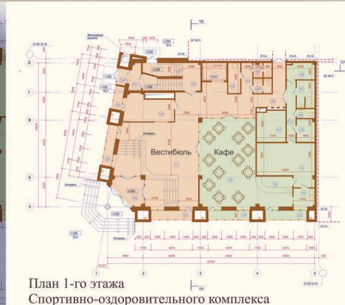
План 1-го этажа Спортивно-оздоровительного комплекса