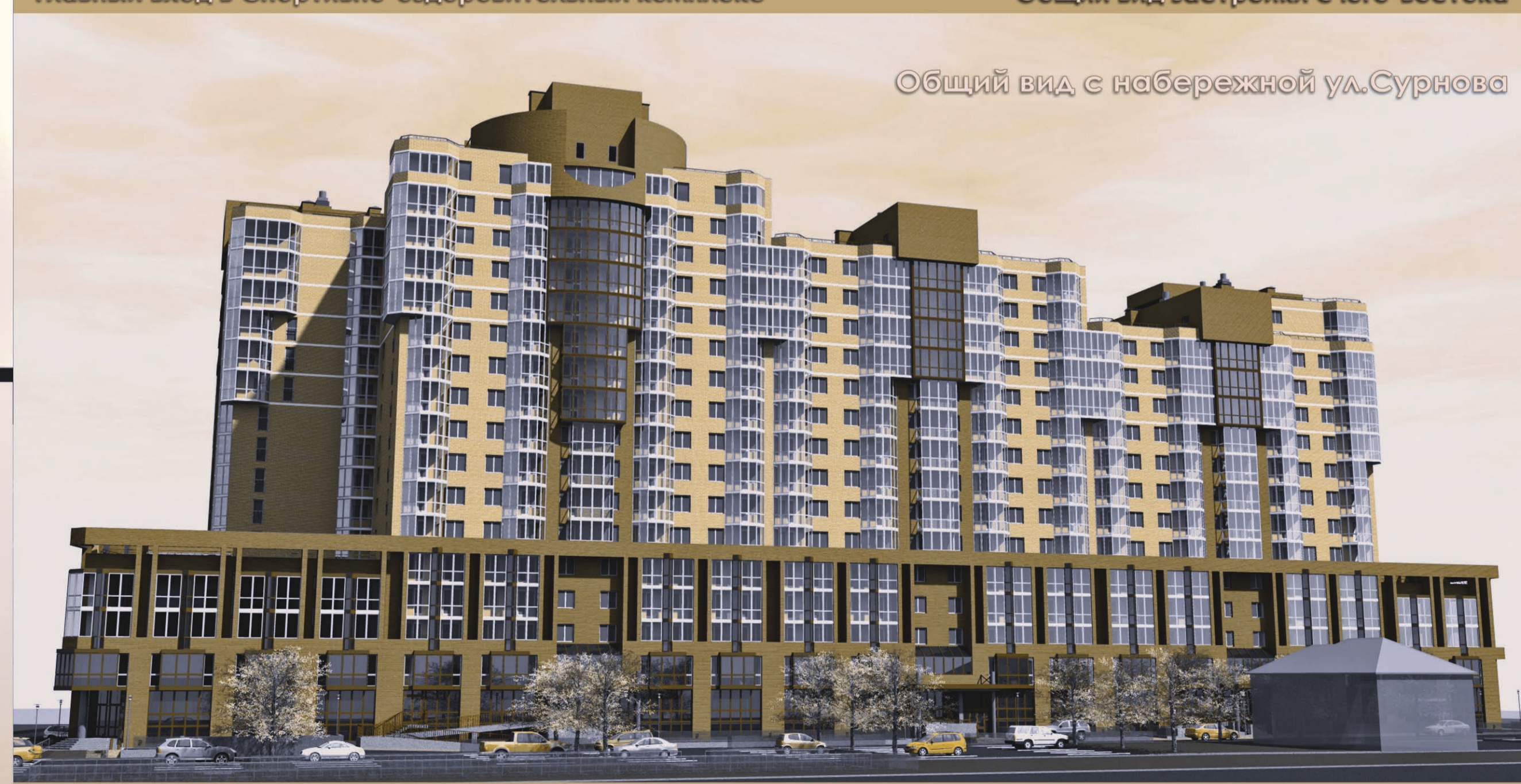
Общий вид с набережной ул. Сурнова