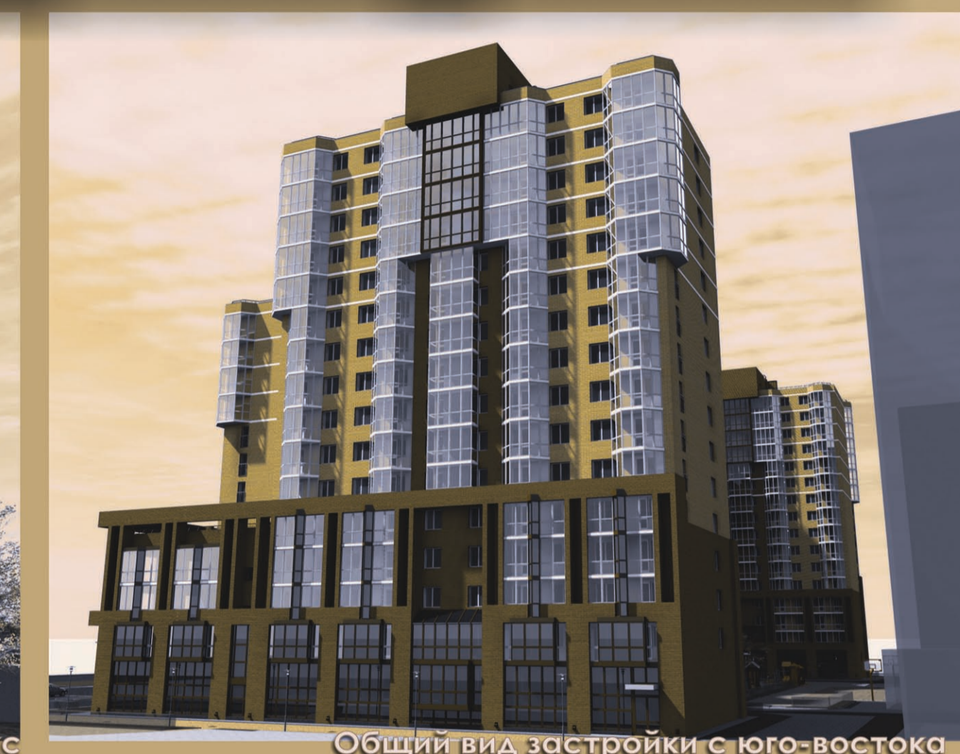
Общий вид застройки с юго-востока