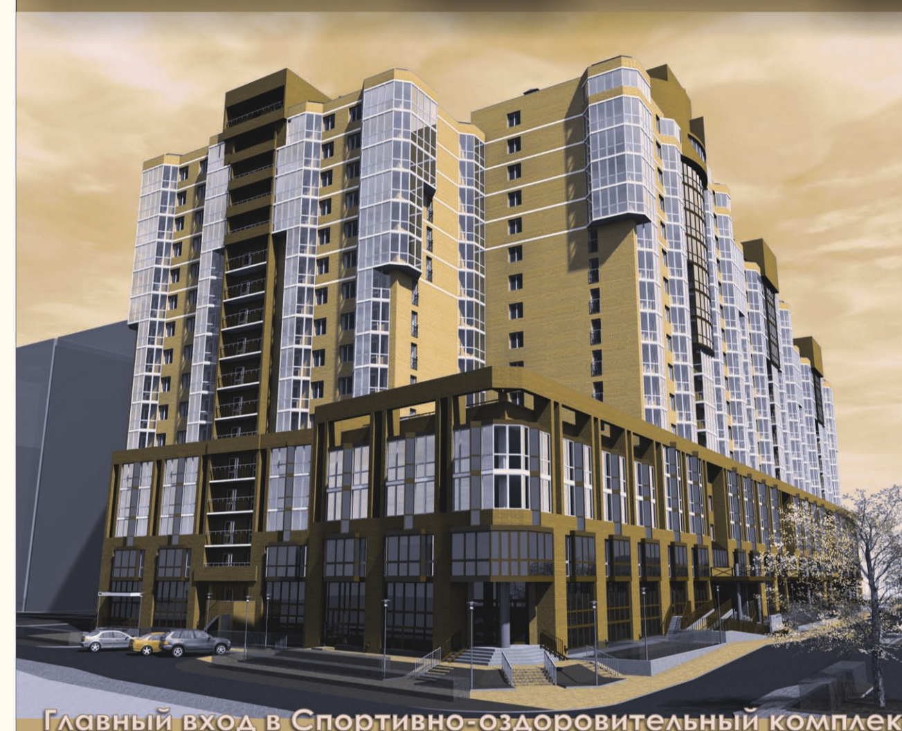
Главный вход в Спортивно-оздоровительный комплекс