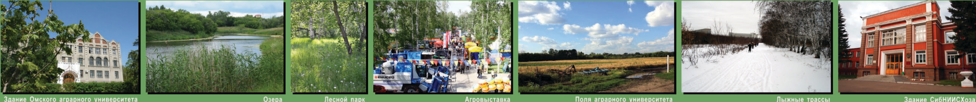
Здание Омского аграрного университета