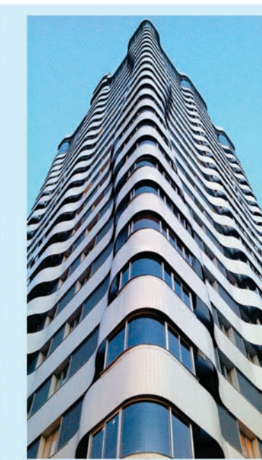
ФОТОГРАФИЯ ФРАГМЕНТА ФАСАДА ЖИЛОГО ДОМА №23 ПО УЛ. ЛЕСКОВА