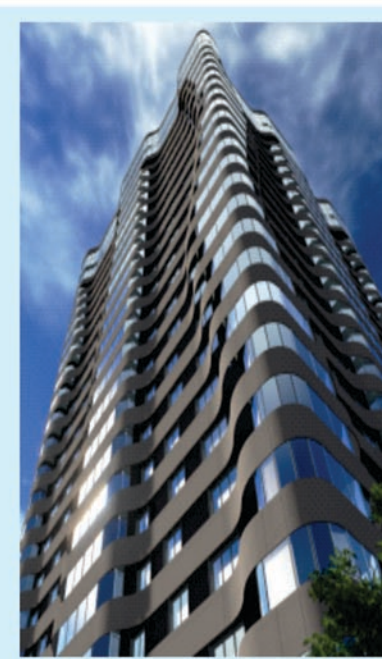
ВИЗУАЛИЗАЦИЯ ФРАГМЕНТА ФАСАДА ЖИЛОГО ДОМА №23 ПО УЛ. ЛЕСКОВА