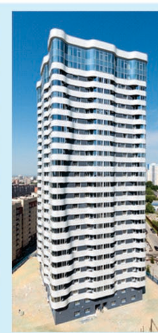
ФОТОГРАФИЯ ЖИЛОГО ДОМА №23 ПО УЛ. ЛЕСКОВА