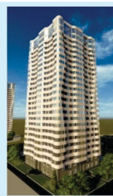
ВИЗУАЛИЗАЦИЯ ЖИЛОГО ДОМА №23 ПО УЛ. ЛЕСКОВА