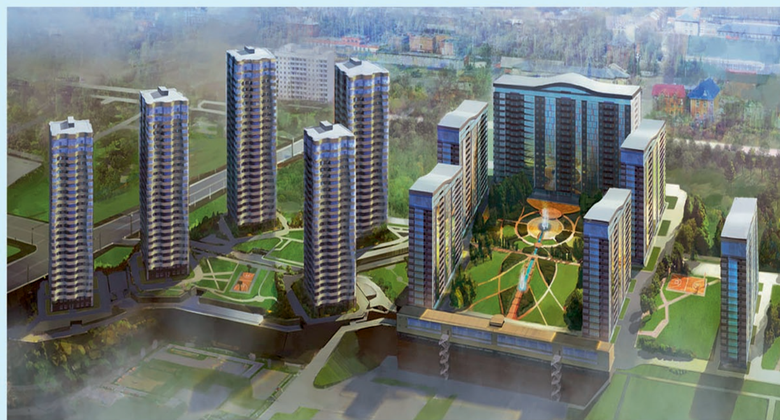
ВИЗУАЛИЗАЦИЯ ЖИЛОГО КОМПЛЕКСА «ОАЗИС»