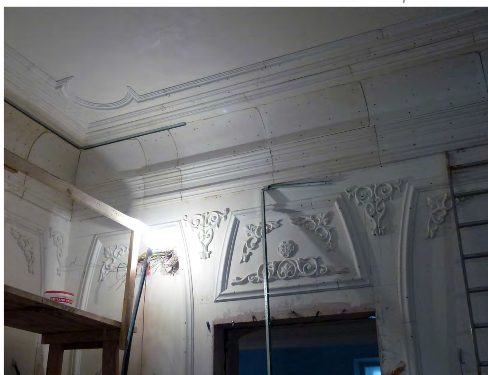
Зал заседаний в процессе воссоздания