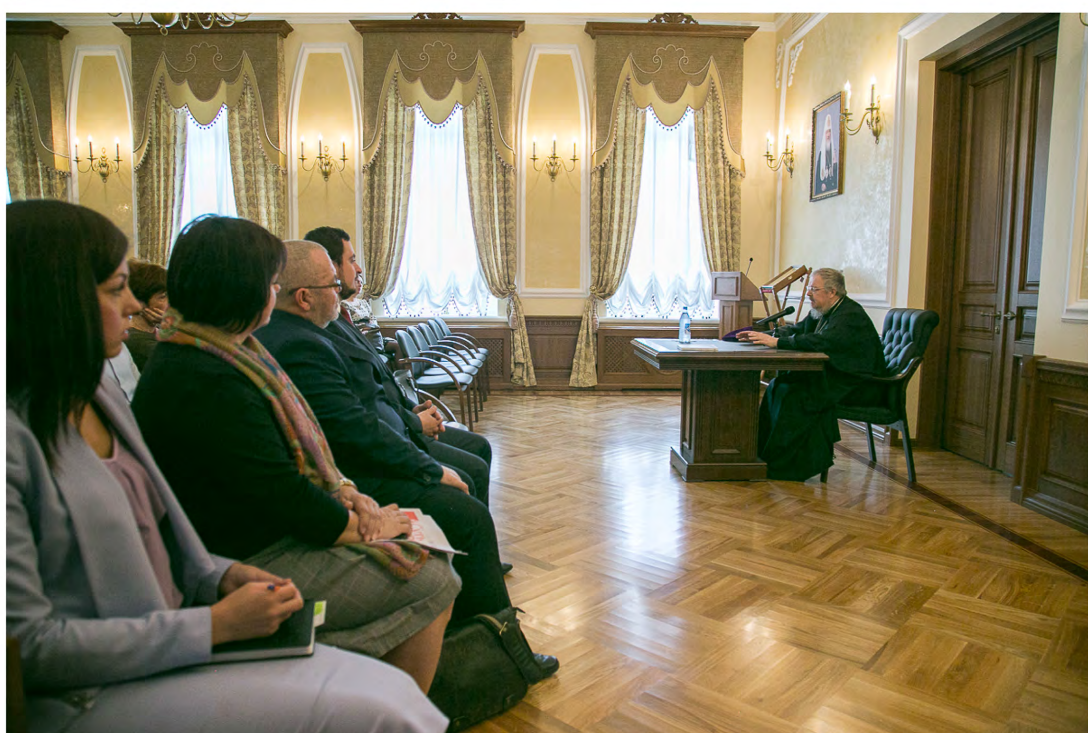
Зал заседаний после воссоздания