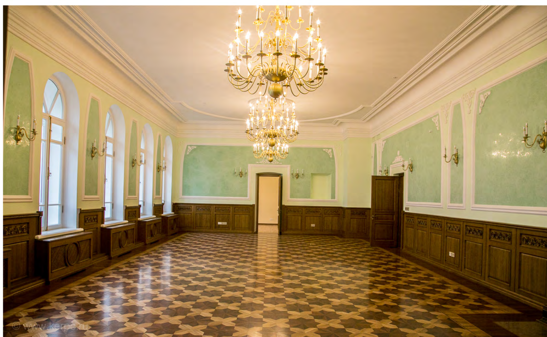
Кабинет архиерея после воссоздания