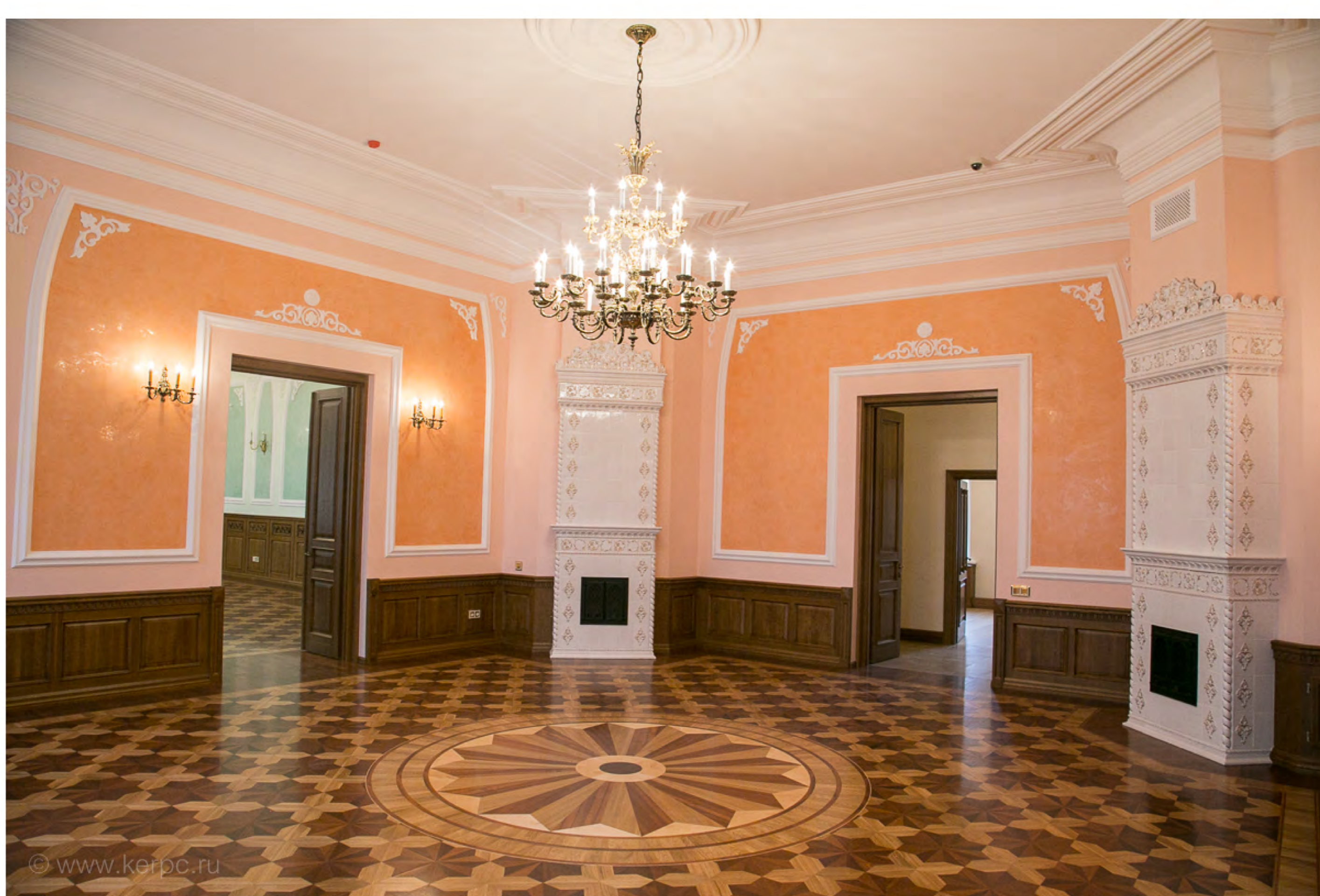
Приёмная после воссоздания