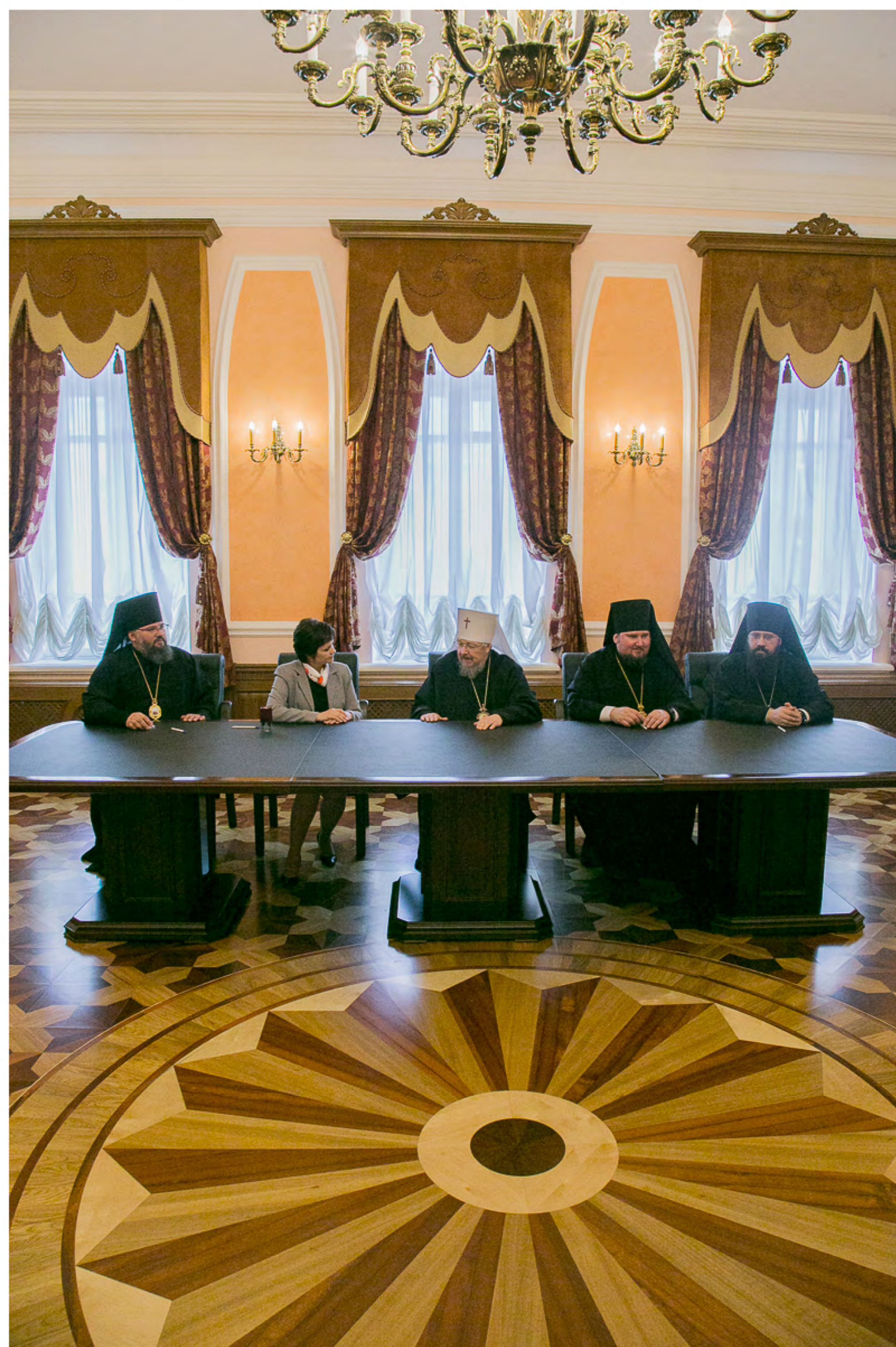
Приёмная после воссоздания