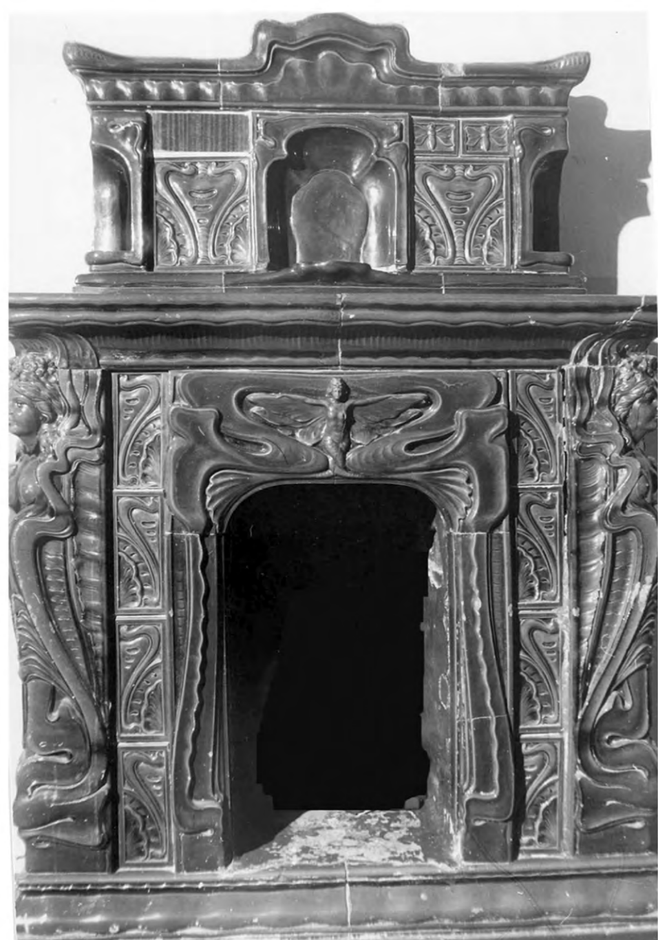
Фото камина 1987 г.