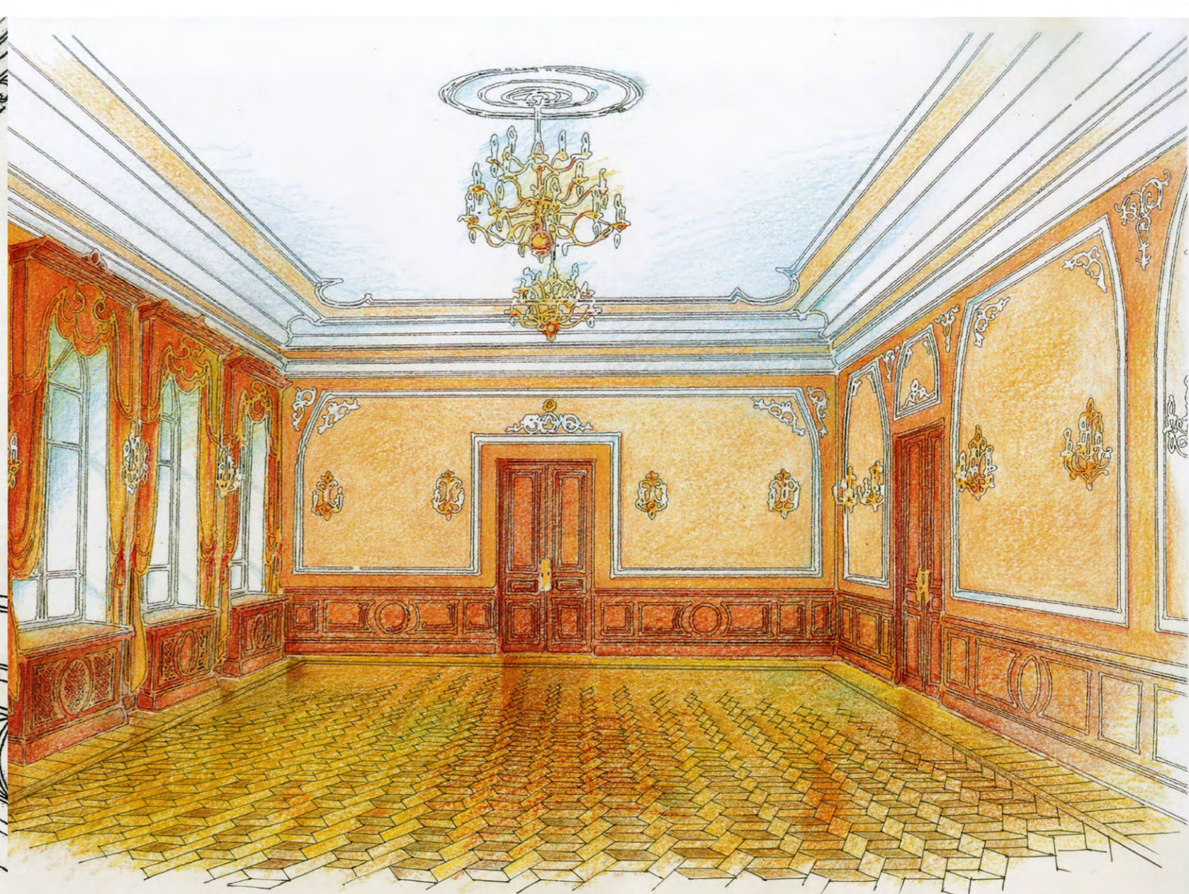
Зал заседаний, эскиз