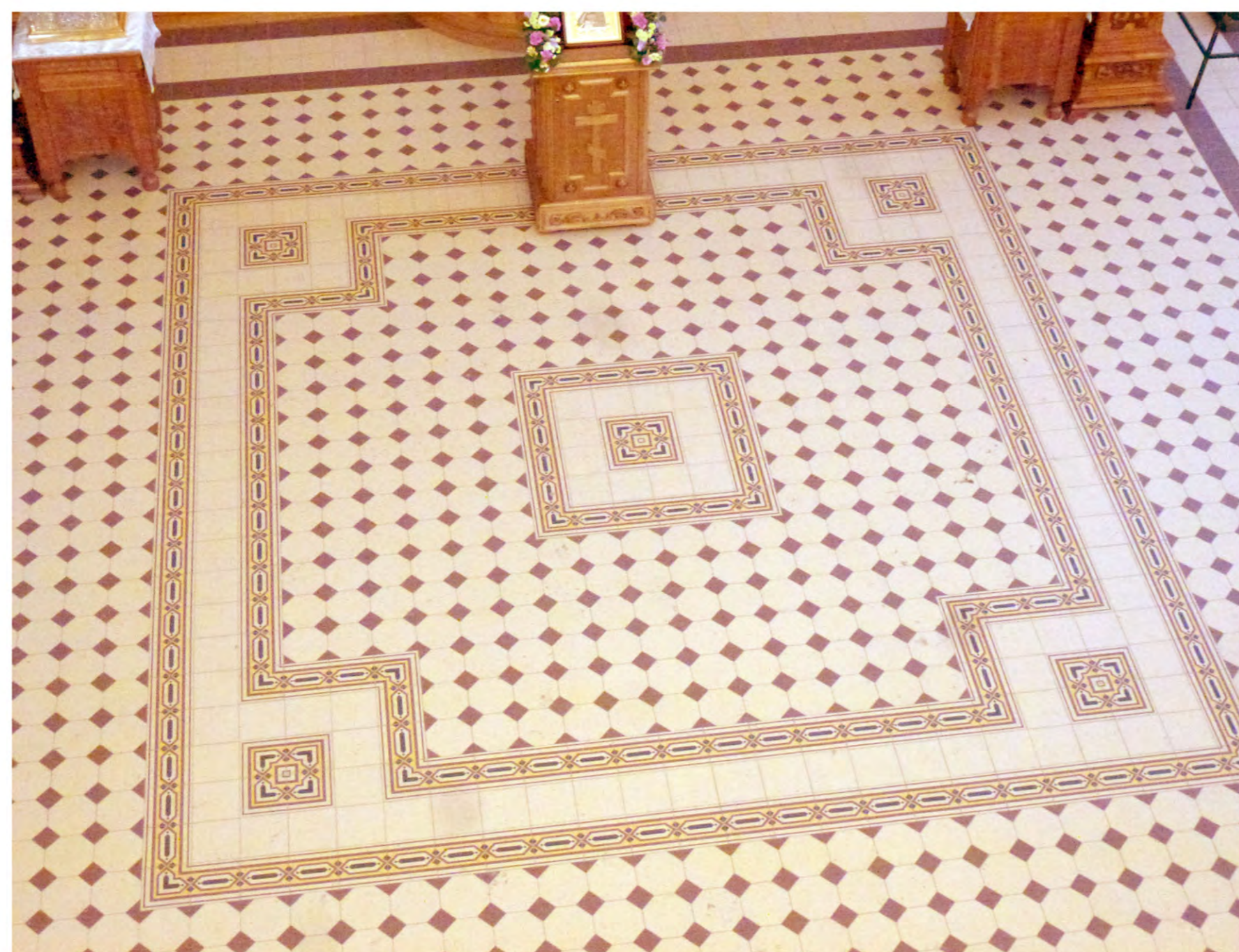
Полы храма после воссоздания