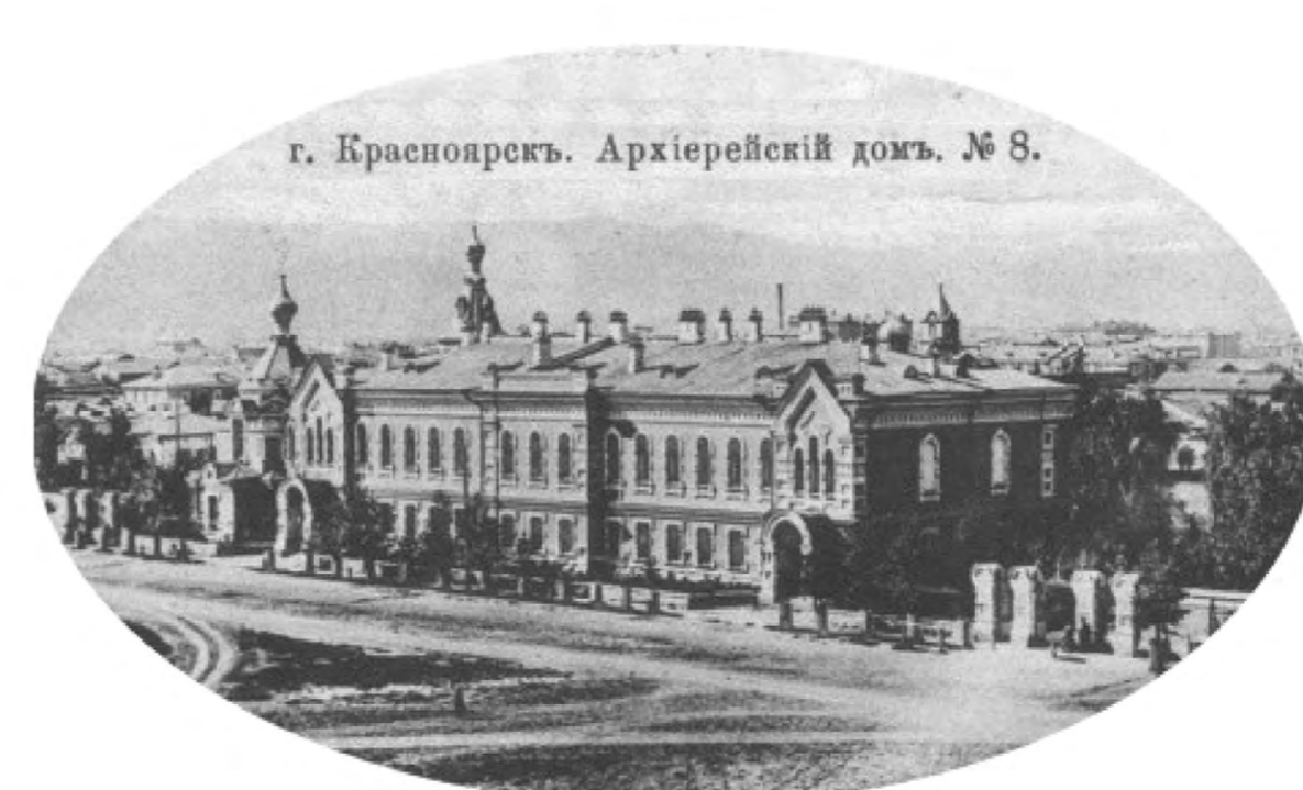
г. Красноярск. Архиерейский дом. № 8.