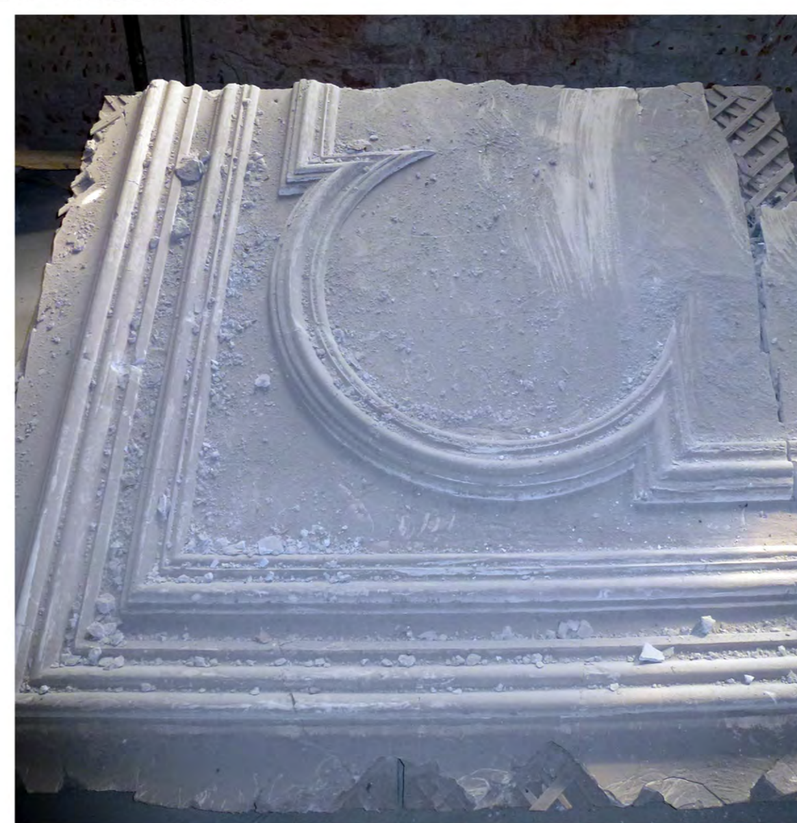
Остатки потолочного декора