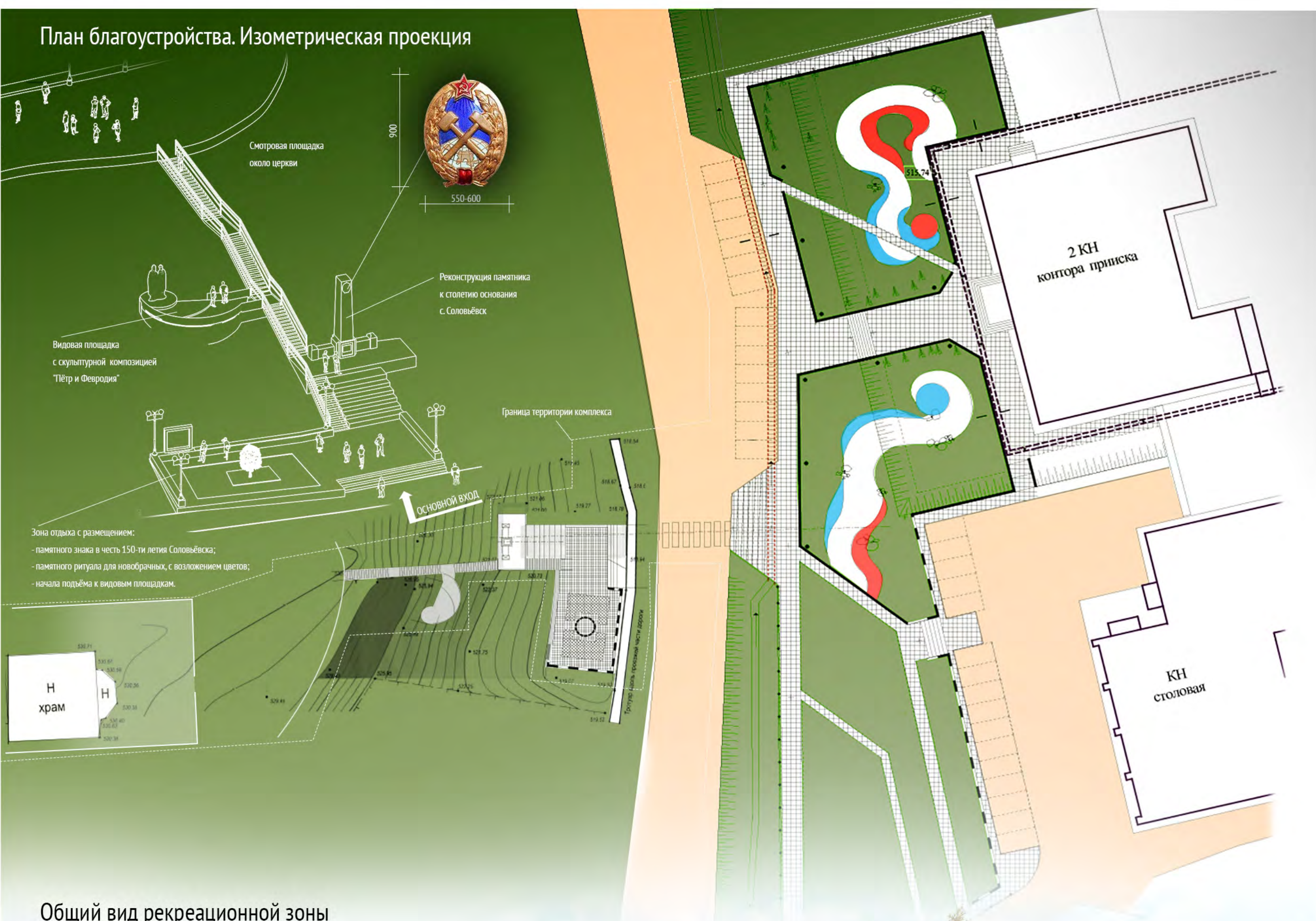
Общий вид рекреационной зоны