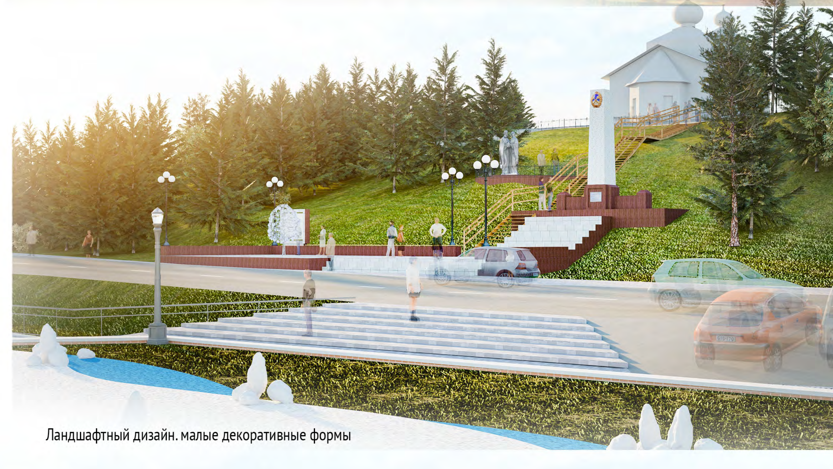
Ландшафтный дизайн. малые декоративные формы