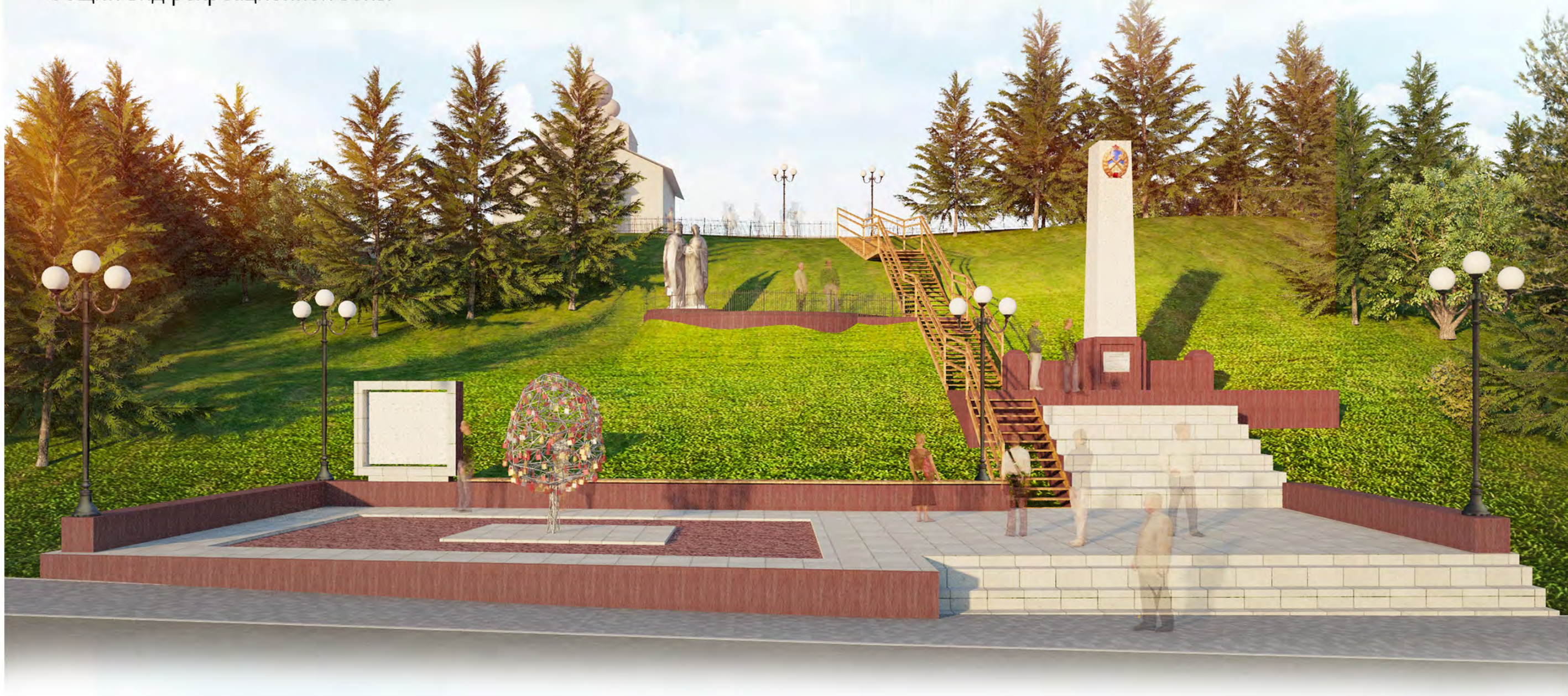
Общий вид рекреационной зоны