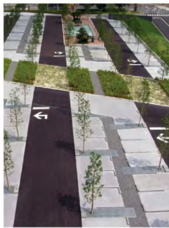
Парковка с зелеными островками