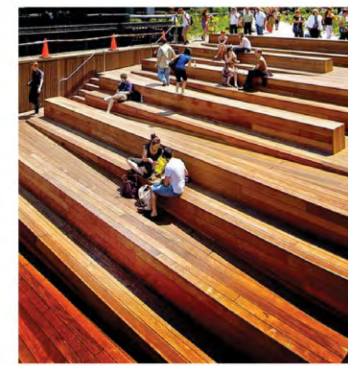
Амфитеатр - и ступеньки, и сиденье, и летний кинотеатр

Деревянная конструкция выполняет три функции - отделяет парковку от площади, служит смотровой площадкой и является частью детской площадки. Так же "внутри" предусмотрены кабинки туалетов.