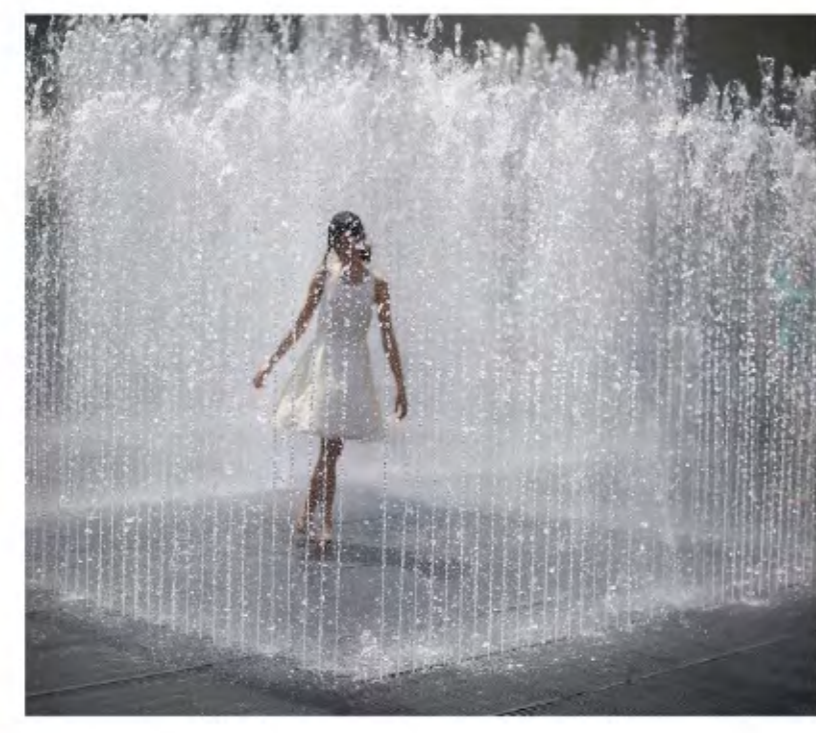
Абсолютный лидер среди детских летних развлечений - сухой фонтан