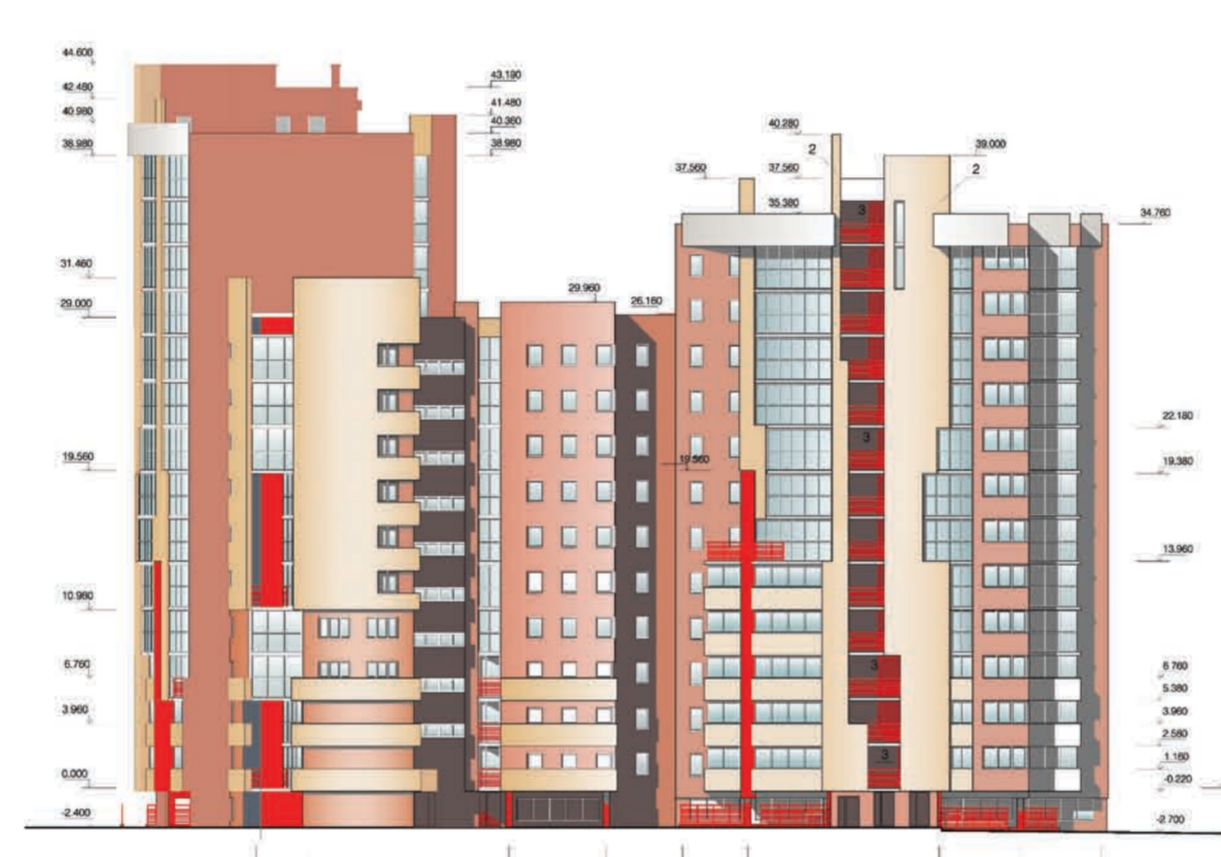
фасад с северной стороны