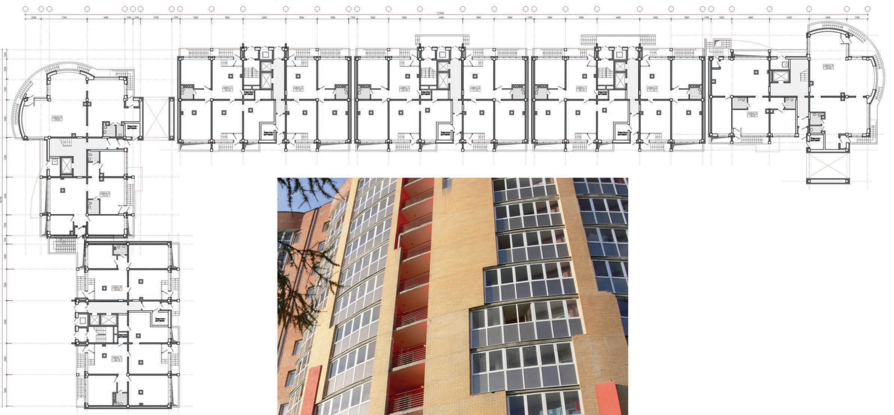
план 1-го этажа