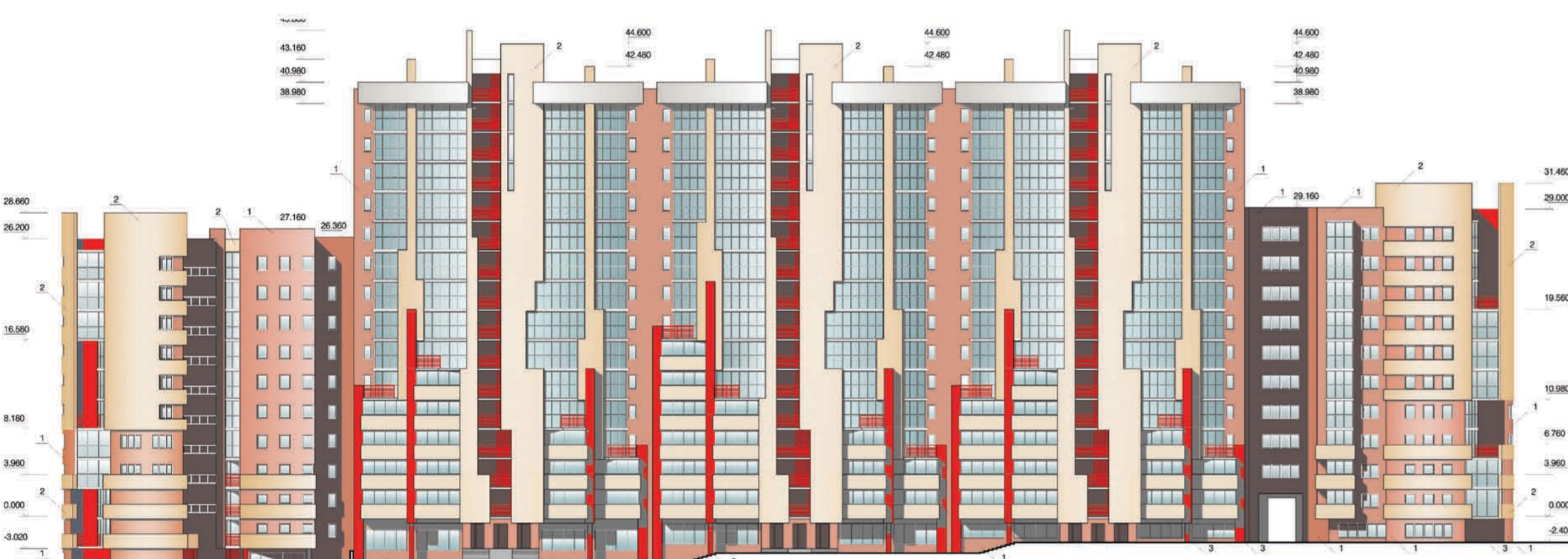
фасад по Бульвару Рябикова

Многоквартирный жилой дом социального типа запроектирован и построен в Свердловском районе г. Иркутска по ул. Маршала Конева и включает в себя 6 индивидуальных блок-секций переменной этажности, выполненных в монолитном каркасе с кирпичным заполнением. Реализация проекта позволила получить 600 малогабаритных квартир, предназначенных для молодых семей. На первых этажах располагаются социальный быт и офисные помещения, в которых также прослеживается идея минимизации. Целью проекта явилось желание совместно решить две задачи: с одной стороны, структура планировки должна быть простой и экономической, с другой – хотелось создать не унылое социальное жилье, а современный объект архитектуры с визуально интересным внешним обликом.